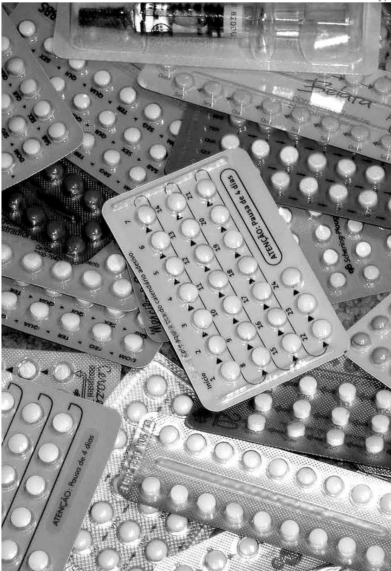
Uso indiscriminado de anticoncepcionais pode acarretar problemas como a trombose e a embolia, segundo os médicos

A agência abriu edital recentemente para montar uma força-tarefa destinada a discutir soluções para o problema. A intenção é formar grupos que sensibilizem farmacêuticos, médicos e usuários sobre a exigência da receita médica para a compra de qualquer medicamento de tarja vermelha, como é o caso dos anticoncepcionais.