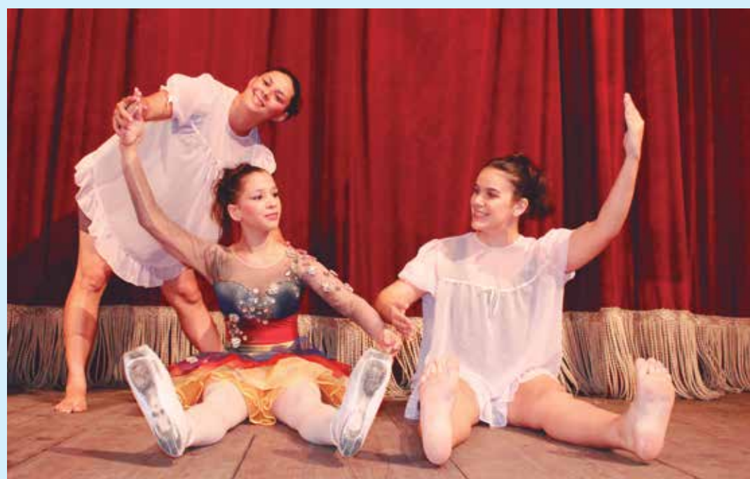
Enquanto o Tempo Chega , do Ballet Jovem da Paraíba, estará no Teatro Minerva