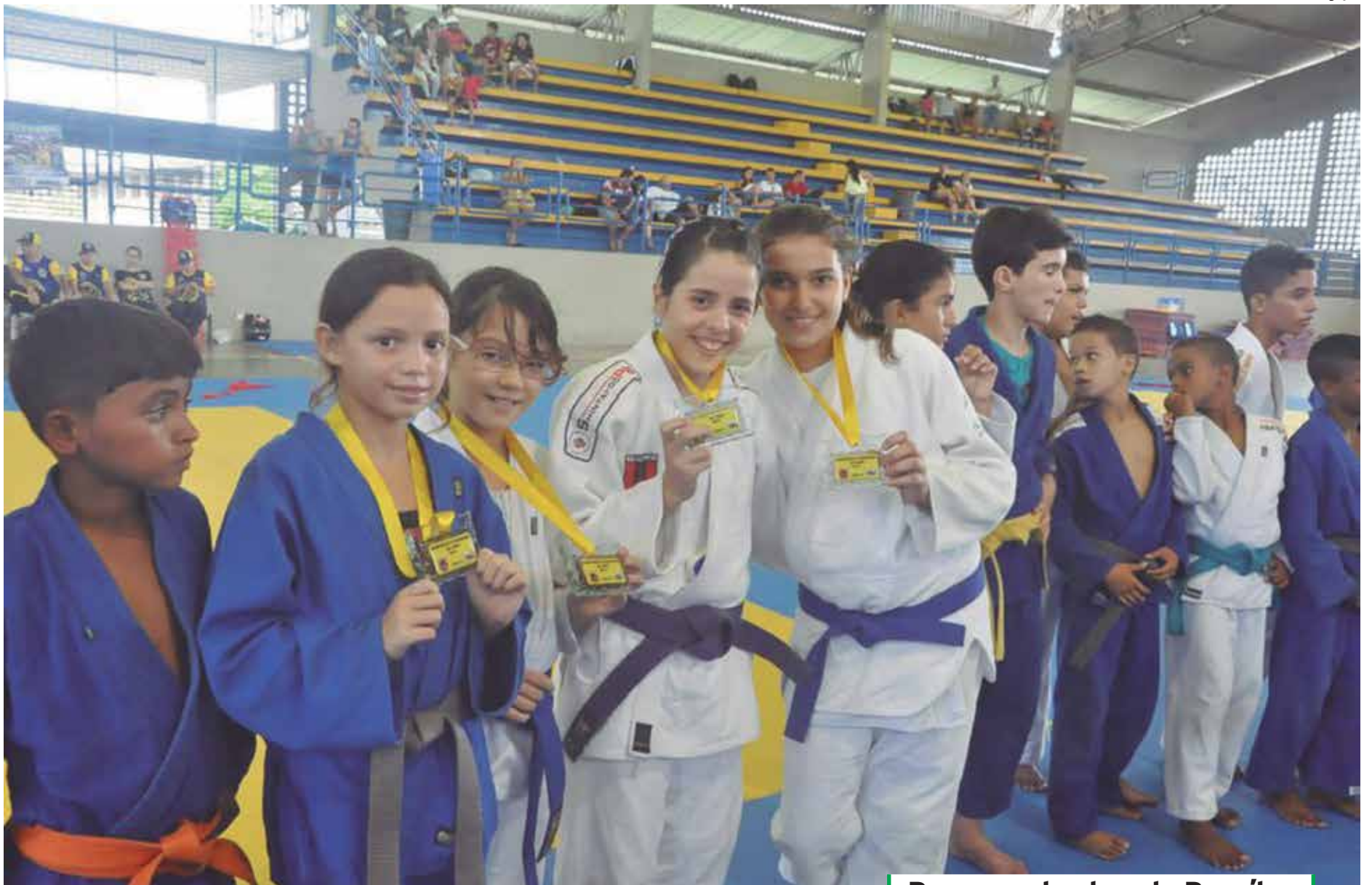
Os atletas paraibanos que vão participar do Campeonato Brasileiro a partir do próximo sábado

O Campeonato Brasileiro Sub-13 de Judô é a fase final da competição. Reúne os campeões das etapas regionais realizadas pela CBJ. Cerca de 300 atletas vão disputar a competição. A Paraíba estará representada por 15 judocas, sendo oito no masculino e igual número no feminino. "A Federação