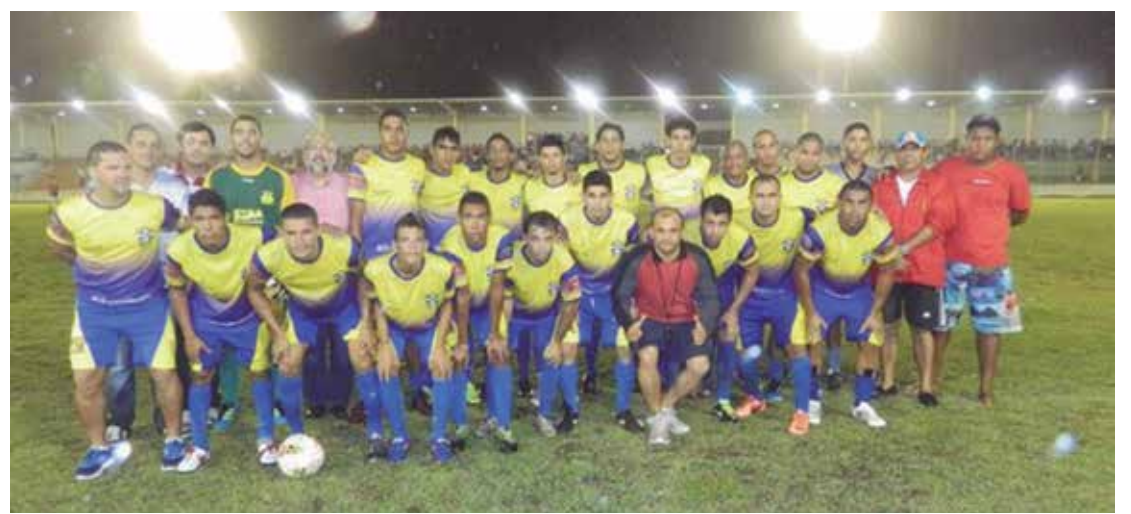
A equipe do Castelo Branco já está na final após vencer o Conjunto João Paulo II por 1 a 0 na Graça