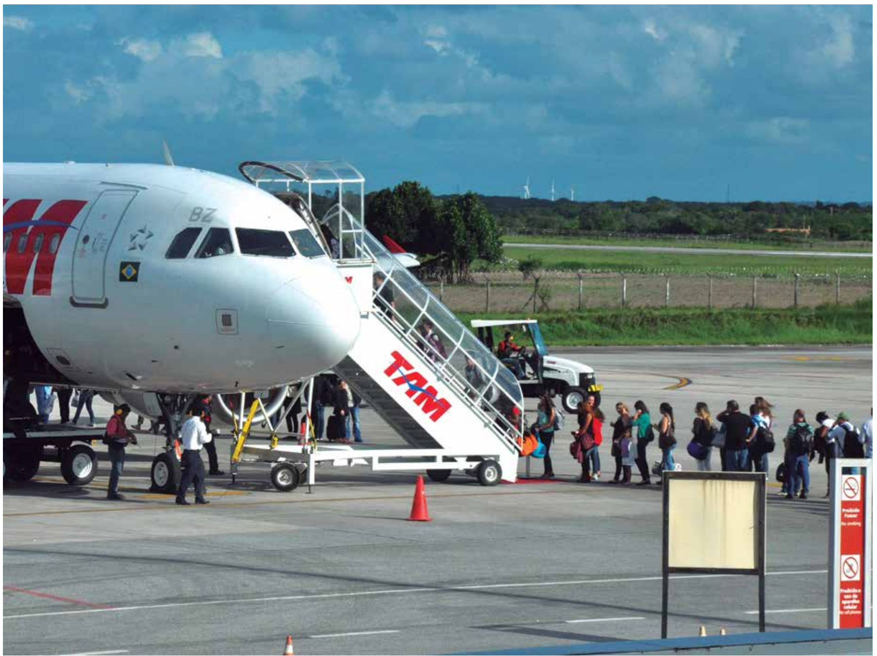
Sindicato diz que greve dos aeroportuários atrasa voos no Castro Pinto; Infraero diz que tem plano de contingência PÁGINA 25