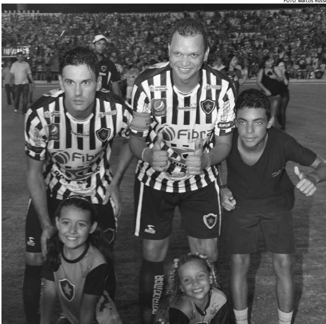
Jogadores do Botafogo estão confiantes e cientes das dificuldades em Vitória da Conquista-BA

O Vitória da Conquista-BA está na terceira colocação, com 7. Apenas o goleiro Genivaldo ficará de fora da partida em solo baiano, já que se recupera de uma lesão de grau 2 na coxa e panturrilha direita. O "paredão" foi vetado pela segunda vez na competição, já que foi substituído por Remerson na vitória (2 a 0), diante do Vitória da Conquista/BA, no Estádio Almeidão, pela quinta rodada da competição. O treinador botafoguense, Marcelo Vilar, deve