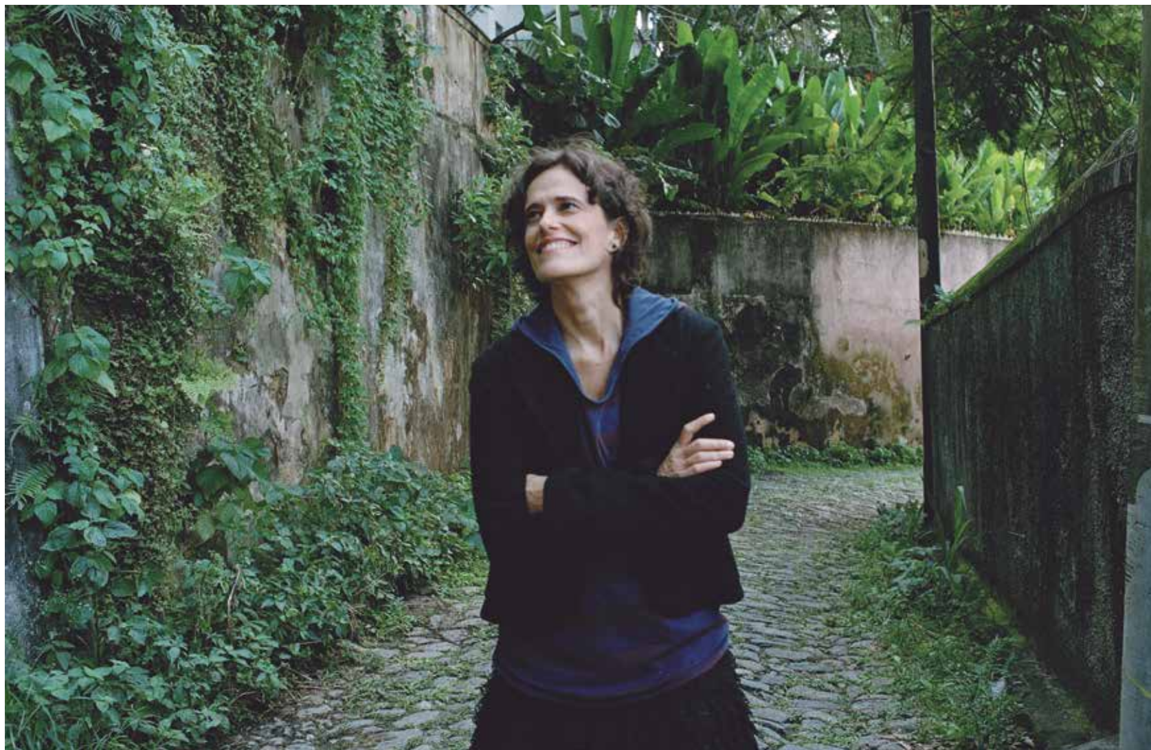
Zélia Duncan traz para a cidade de Areia o show da turnê Tudo Esclarecido, com músicas do seu disco mais recente