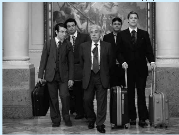
Comédia com Fábio Porchat continua em cartaz na capital