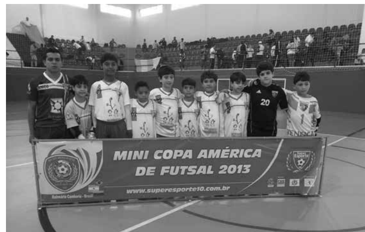
Os garotos do Benfica que conquistaram a Mini Copa América