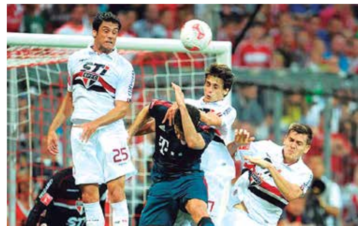
Com resultado de ontem, Tricolor soma 13 derrotas seguidas