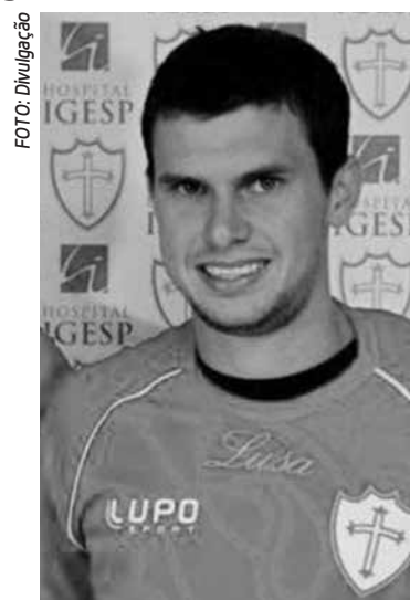
Rafael já jogou na Portuguesa

Com uma vitória, um empate e quatro derrotas em seis jogos, o Galo não pode mais