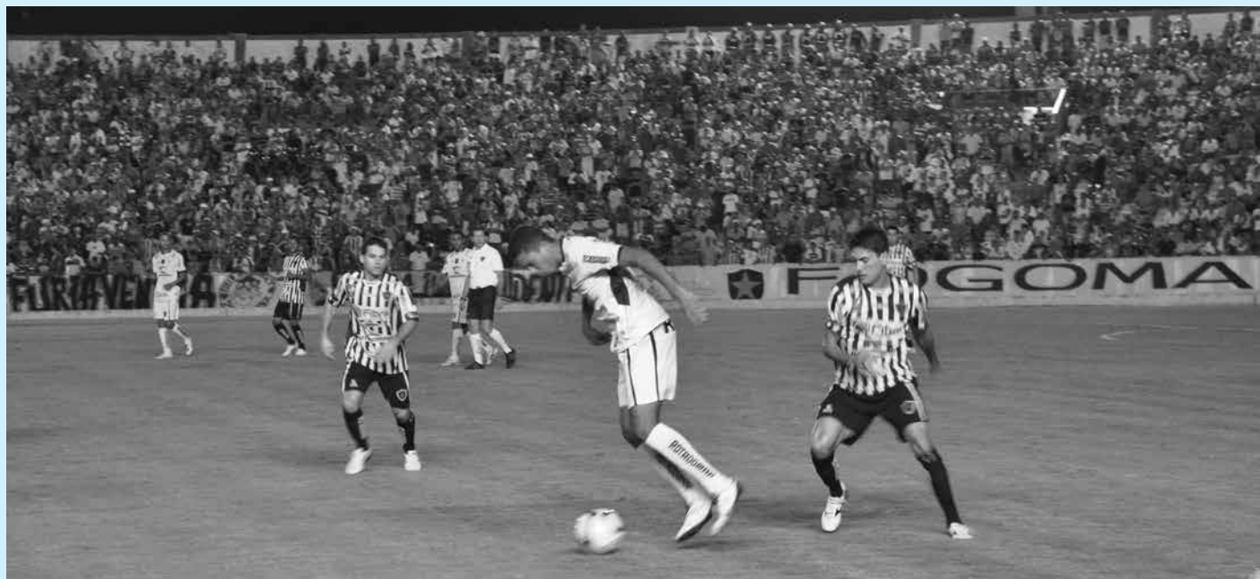
Mesmo havendo jogos no Almeidão, as obras estão sendo realizadas na marquise e arquibancadas e ficarão prontas em 2014