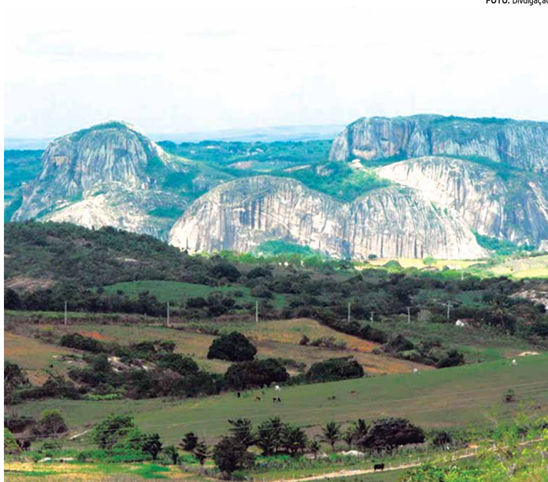
Planalto da Borborema, conhecido como Serra da Borborema, marcante relevo da região Nordeste

Um dos principais objetivos da Conferência Municipal é propiciar a integração entre o poder público e os segmentos da sociedade com a finalidade de avançar na discussão sobre assuntos relacio-