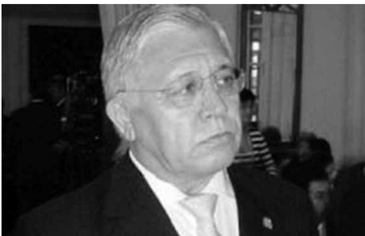
Peregrinação de Quintans foi iniciada desde setembro de 2012

O presidente da Comissão Suprapartidária do Poder Legislativo, deputado