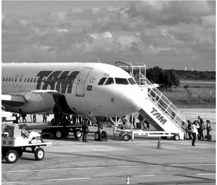
O movimento teve início à 0h de ontem, com um protesto

Voos que chegarem ao Estado serão prejudicados e sofrerão atrasos, diz sindicato